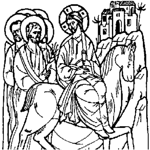
1 st Antiphon

Antifonul 1. Iubit-am pe Domnul, că a auzit glasul rugăciunii mele. Că a plecat urechea Lui spre mine și în zilele mele Îl voi chema.